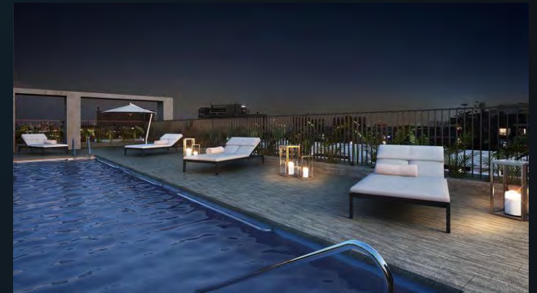
Suecia 440, Providencia