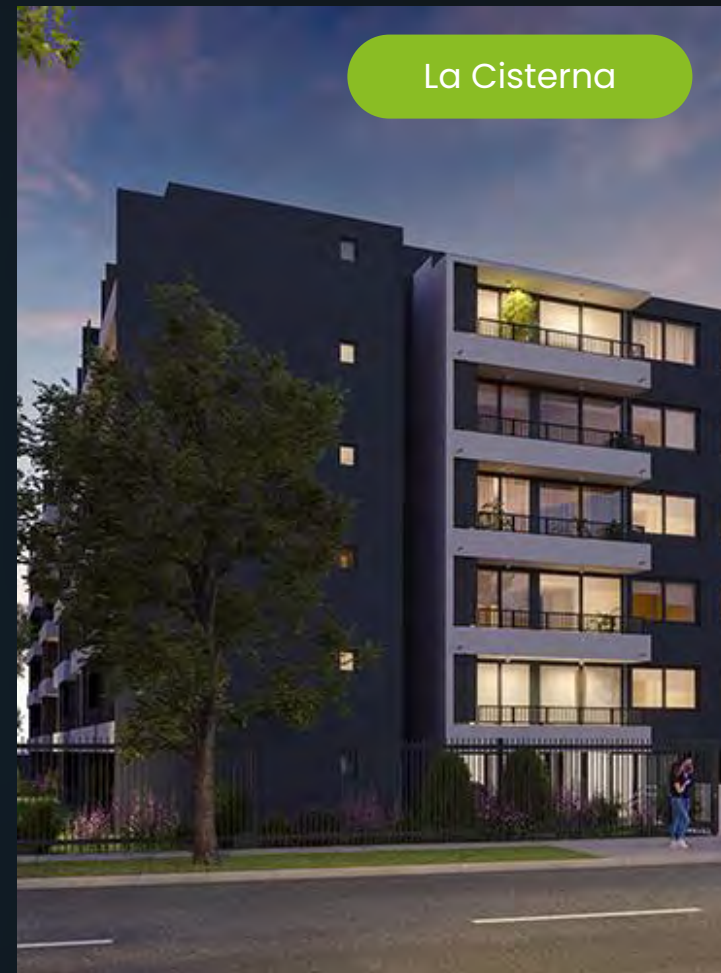
Las Brisas 177, La Cisterna